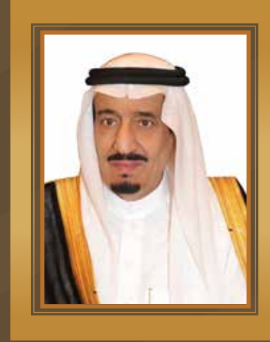
خادم الحرمين الشريفين الملك سلمان بن عبد العزيز آل سعود