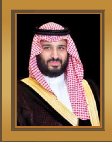
ولي العهد صاحب السمو الملكي الأمير محمد بن سلمان آل سعود